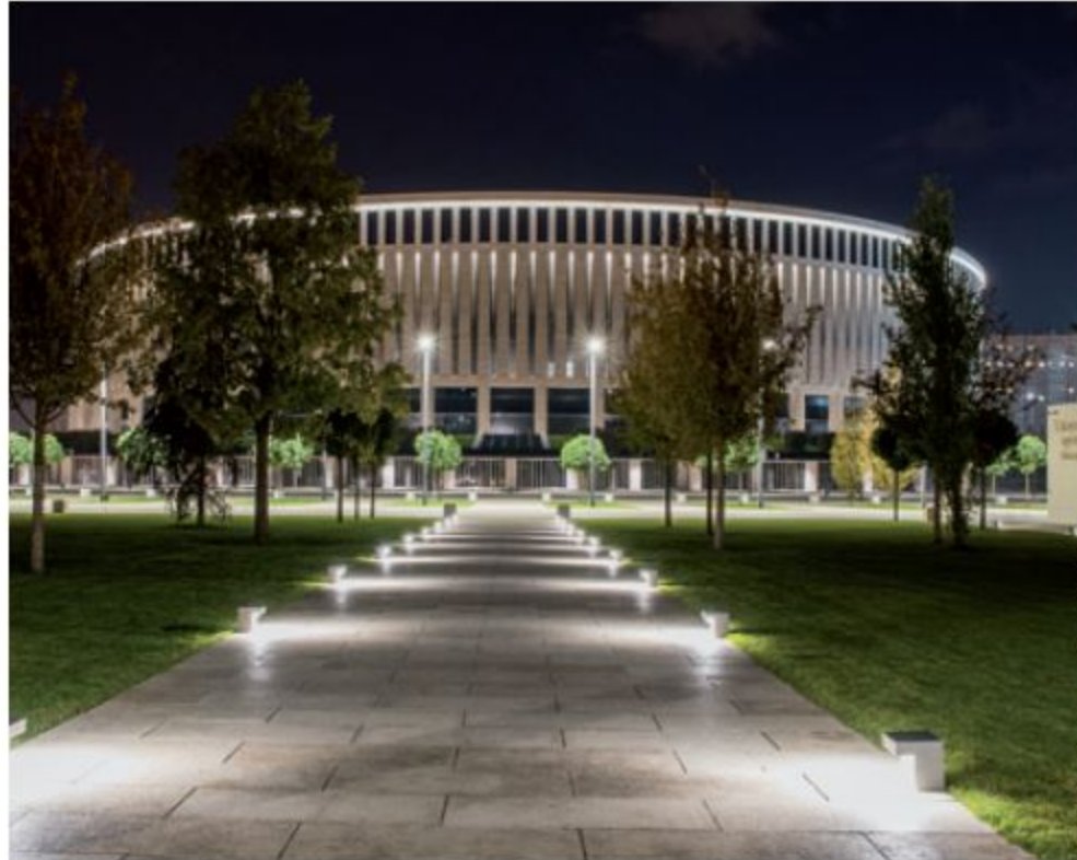
Adel Bikulov/gmp Architekten

Das von gmp Architekten geplante Fußballstadion des russischen Erstligisten FC Krasnodar wurde 2016 eingeweiht, seit kurzem ist auch das umliegende Parkgelände fertig. Das Lichtkonzept für Stadion und Park stammt von Conceptlicht aus Traunreut, nach deren Vorgaben LMT Leuchten + Metall Technik zahlreiche Sonderleuchten lieferte. Bei Tageslicht strahlt die von kannelierten Pilastern in drei horizontale Ebenen gegliederte Travertinfassade des Stadionbaus beinahe weiß. Diese Anmutung bleibt auch bei der nächtlichen Beleuchtung bestehen, da