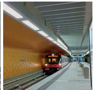
N Klinikum Nord