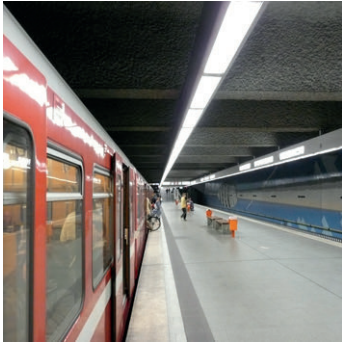
N Hohe Marter