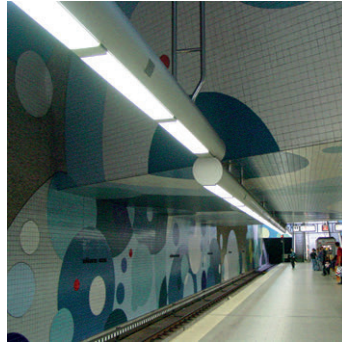
N Wöhrder Wiese